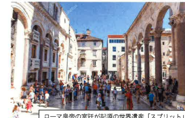
ローマ皇帝の宮廷が起源の世界遺産「スプリット」