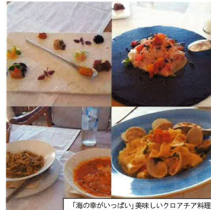
「海の幸がいっぱい」美味しいクロアチア料理