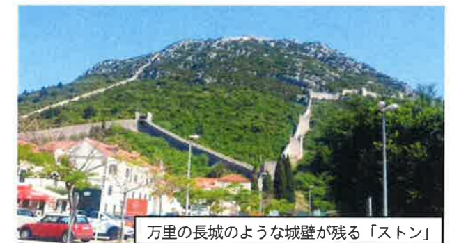
万里の長城のような城壁が残る「ストーン」