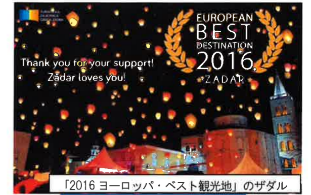
「2016ヨーロッパ・ベスト観光地」のザダル