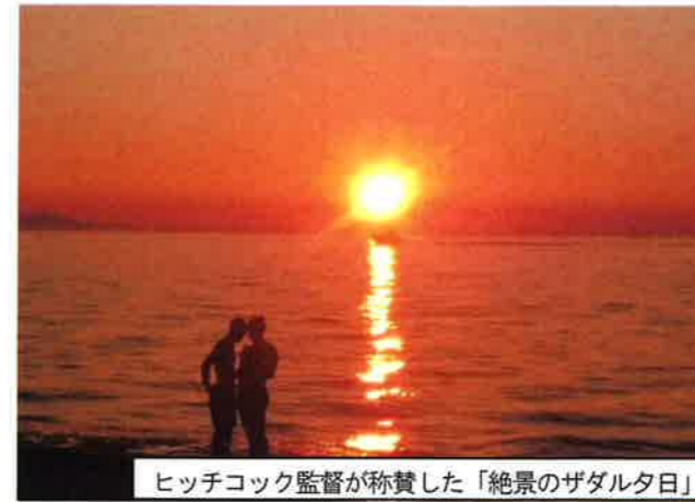
ヒッチコック監督が称賛した「絶景のザダル夕日」