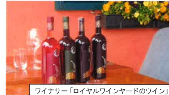
ワイナリー「ロイヤルワインヤードのワイン」